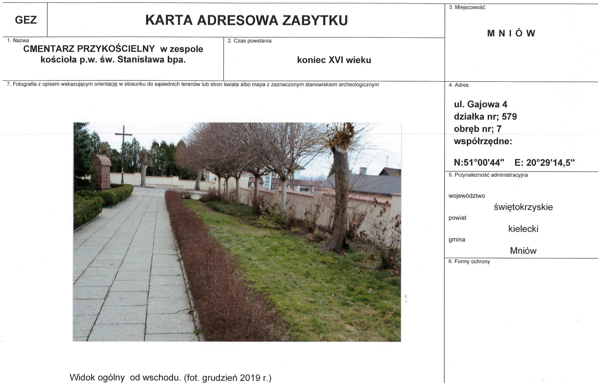
Widok ogólny od wschodu. (fot. grudzień 2019 r.)